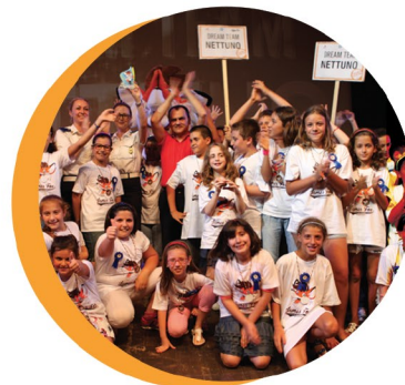
Momenti emozionanti dell'edizione 2013

La finale si è svolta al Teatro di Aprilia (LT) ed ha coinvolto ragazzi e genitori da tutta la Regione che insieme hanno vissuto una giornata indimenticabile.