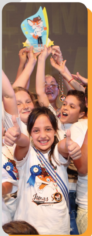
Finale Regionale 2013

Con James Fox la sicurezza , la legalità diventano un gioco coinvolgente, una scoperta, un momento di festa.